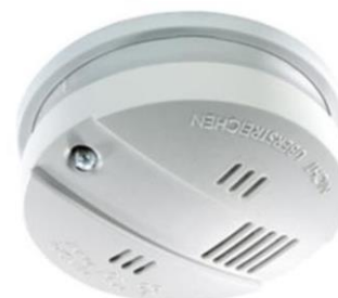
Abb. 4.2: Rauchwarnmelder

⇒ Es ist verboten an den Rauchwarnmeldern Veränderungen vorzunehmen. Sollte bei Zuwiderhandlungen ein Schaden entstehen, muss dieser dem Verursacher weiterverrechnet werden.