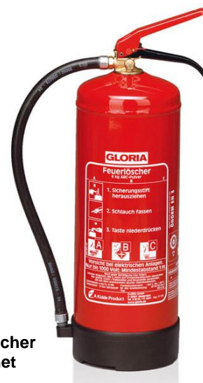
Abb. 4.1: Handfeuerlöscher