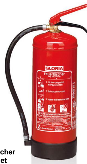
Abb. 4.2: Handfeuerlöscher