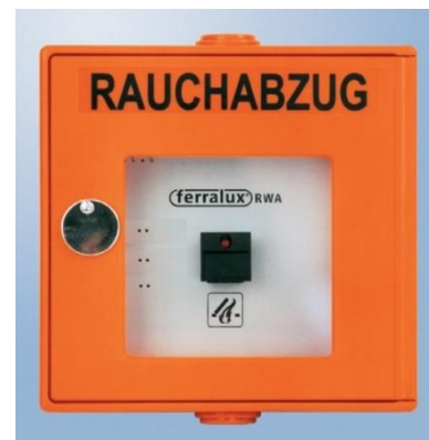
Abb. 4.3: Rauchabzugstaster

Der Rauchabzugstaster bewirkt keine automatische Alarmmeldung der Feuerwehr wie die Druckknopfmelder. Betätigen Sie daher im Ernstfall zusätzlich Druckknopfmelder und alarmieren sie die Feuerwehr via Telefon.